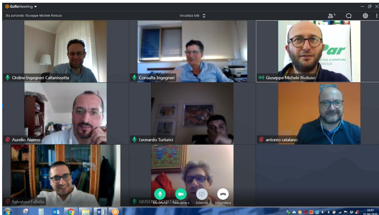
Figura 1 Screen shot inizio riunione di Consiglio