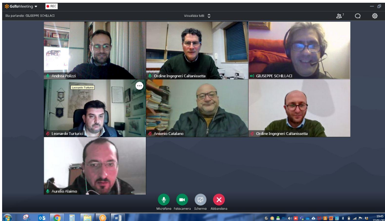
Figura 1 Screen shot inizio riunione di Consiglio

Il Consigliere Segretario ha altresì verificato che tutti i Consiglieri collegati in videoconferenza abbiano la reciproca percezione audiovisiva che consenta loro di partecipare in via simultanea e su un piano di perfetta parità al dibattito; mediante una simulazione è stata inoltre verificata la possibilità di prendere visione, di condividere, far circolare e scambiare contestualmente documenti da poter esaminare nel corso della riunione.